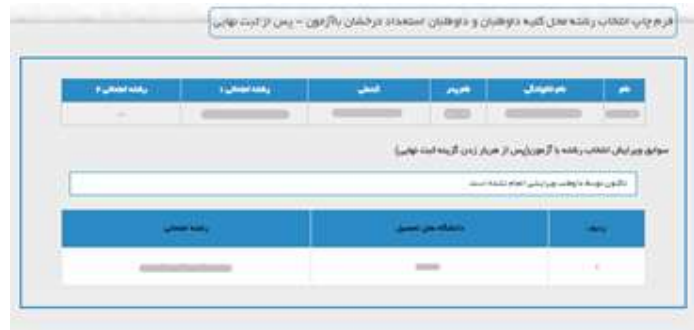
مخصوص استعداد درخشان بدون آزمون